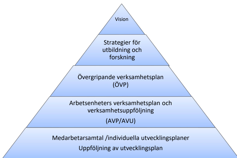
Figur 2. Ledningssystem vid Högskolan Väst

Att bryta ner och konkretisera vision och strategi är ledningens viktigaste styrmetod för verksamheten. Ledning finns på olika organisatoriska nivåer i samma syfte – att styra och leda verksamheten. Ledningen stödjer organisationen genom att operationalisera och förtydliga vilka mål och aktiviteter som ska genomföras för att bidra till att hela högskolan strävar mot visionen. Detta sker operativt genom det strategiska årshjulet med sex strategiskt viktiga områden. Högskolans ledningsgrupp följer upp, diskuterar och ger utvecklingsförslag för dessa områden som sedan förs in i den övergripande verksamhetsplanen. Den treåriga övergripande verksamhetsplanen (ÖVP) uppdateras årligen. Denna målstyrning från vision till konkretion utgör högskolans ledningsprocesser, vilka utgör basen av högskolans ledningssystem. Ledningssystemet ska fungera på alla nivåer i organisationen och hänga samman från vision och ned till enskild medarbetares plan för utveckling, se Figur 2.